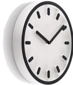
90 minutos cada taller