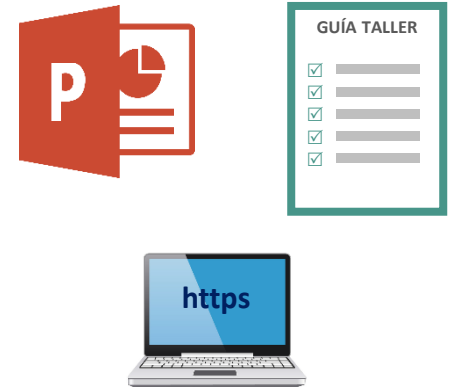
Os facilitamos todo lo necesario