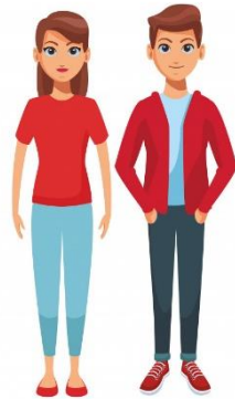
2 voluntarios por taller