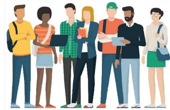
Grupos de 10-12 personas