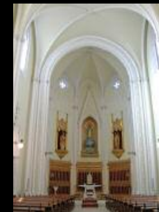
Acuerdo con el Colegio de las Irlandesas de Castilleja de la Cuesta (Sevilla), para la iluminación de la capilla.