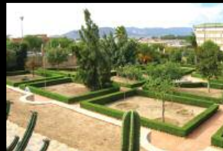
Acuerdo con la Universidad de Málaga, para la iluminación del Jardín Botánico de la Universidad.