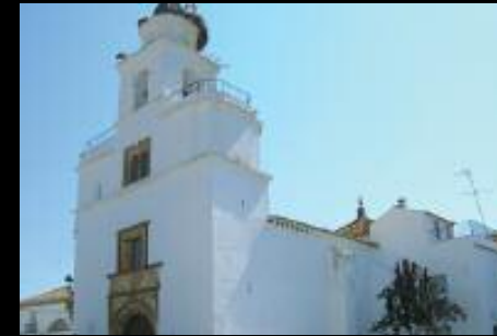
Acuerdo con el Ayuntamiento de San Nicolás del Puerto (Sevilla), para la iluminación del Cruzero de Piedra y de la Iglesia de San Diego.