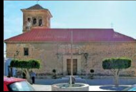
Acuerdo con el Ayuntamiento de Enix (Almería), para la iluminación de la Iglesia de San Judas Tadeo.