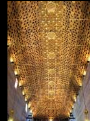
Acuerdo con el ayuntamiento de Utrera (Sevilla) y el santuario de la Virgen de la Consolación, para la iluminación del santuario.