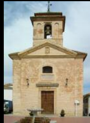
Acuerdo con el Ayuntamiento de Nívar (Granada), para la iluminación de la Iglesia Santo Cristo de la Salud.