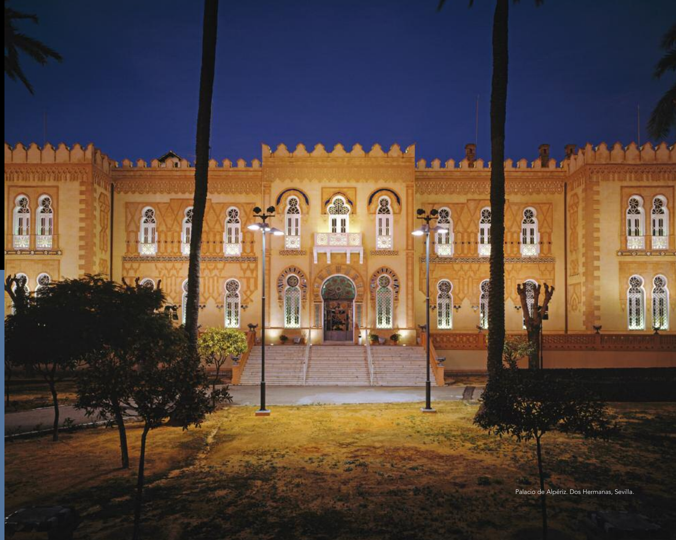
Palacio de Alperiz. Dos Hermanas, Sevilla.