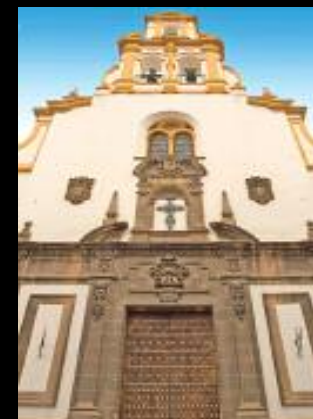
Acuerdo con Iglesia Parroquial de Santa Cruz de Sevilla, para la iluminación del templo parroquial.