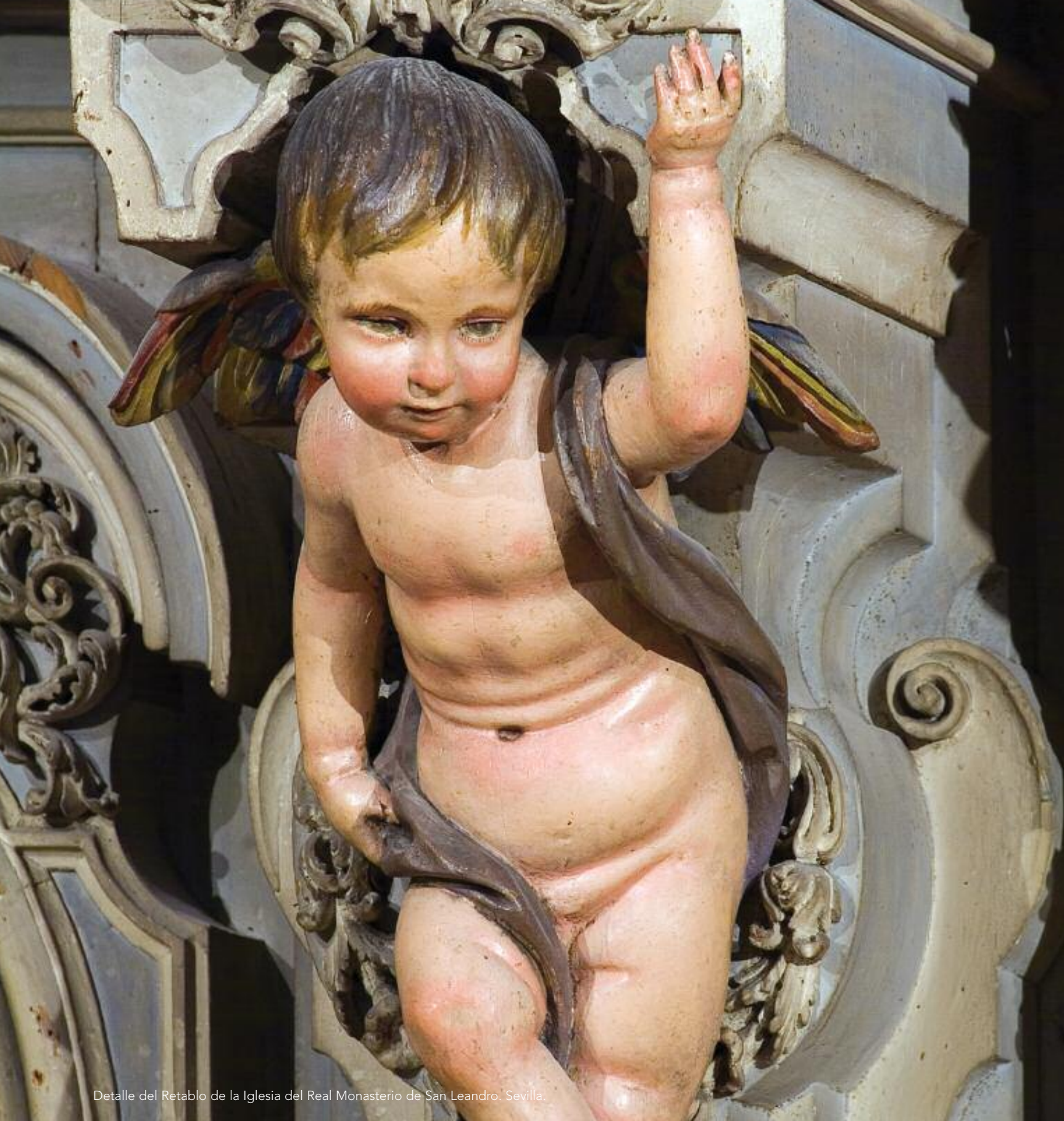
Detalle del Retablo de la Iglesia del Real Monasterio de San Leandro, Sevilla.