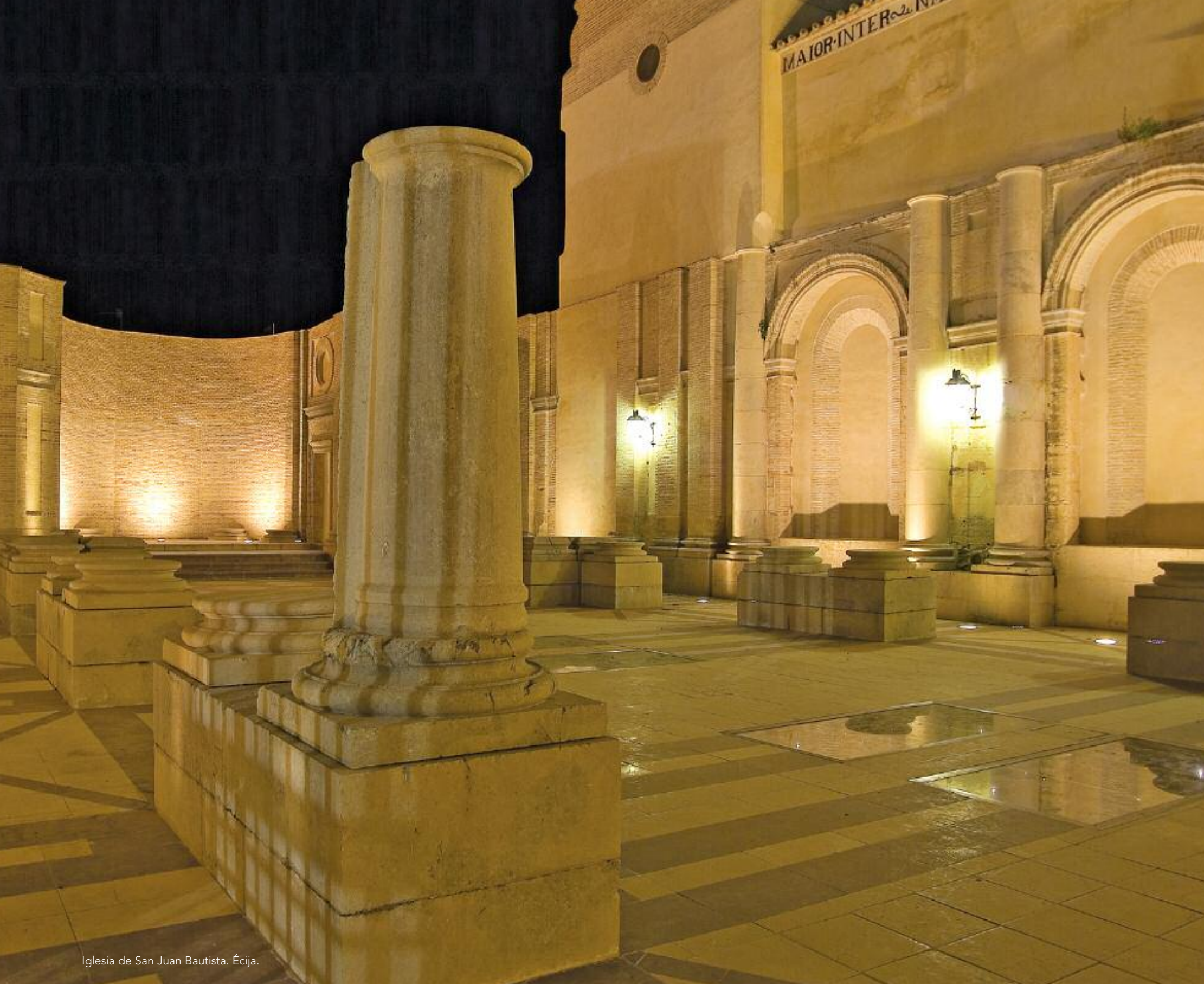
Iglesia de San Juan Bautista. Écija.