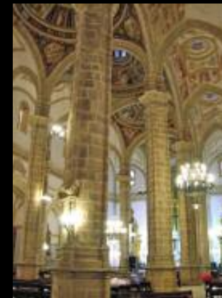
Acuerdo con Iglesia Parroquial de la Anunciación de Villacarrillo (Jaén), para la iluminación del templo parroquial.