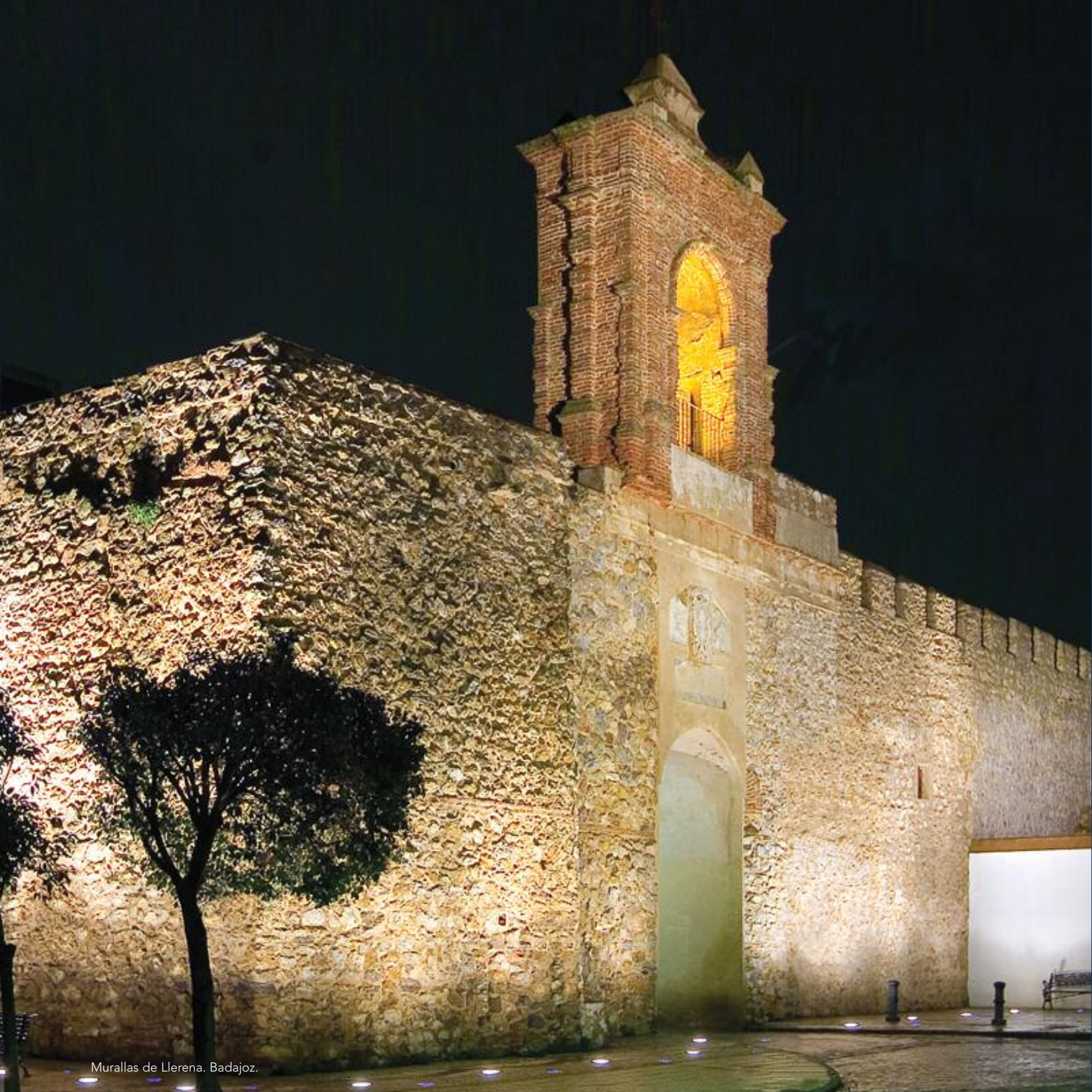
Murallas de Llerena. Badajoz.