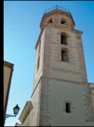
Acuerdo con el Ayuntamiento de Alhama de Almería (Almería), para la iluminación de la Torre de la Iglesia de San Nicolás de Bari.