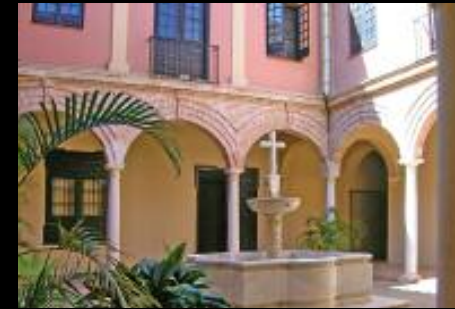
Acuerdo con la Agrupación de Cofradías de Semana Santa de Málaga, para la iluminación del Museo y de la Iglesia de San Julián.