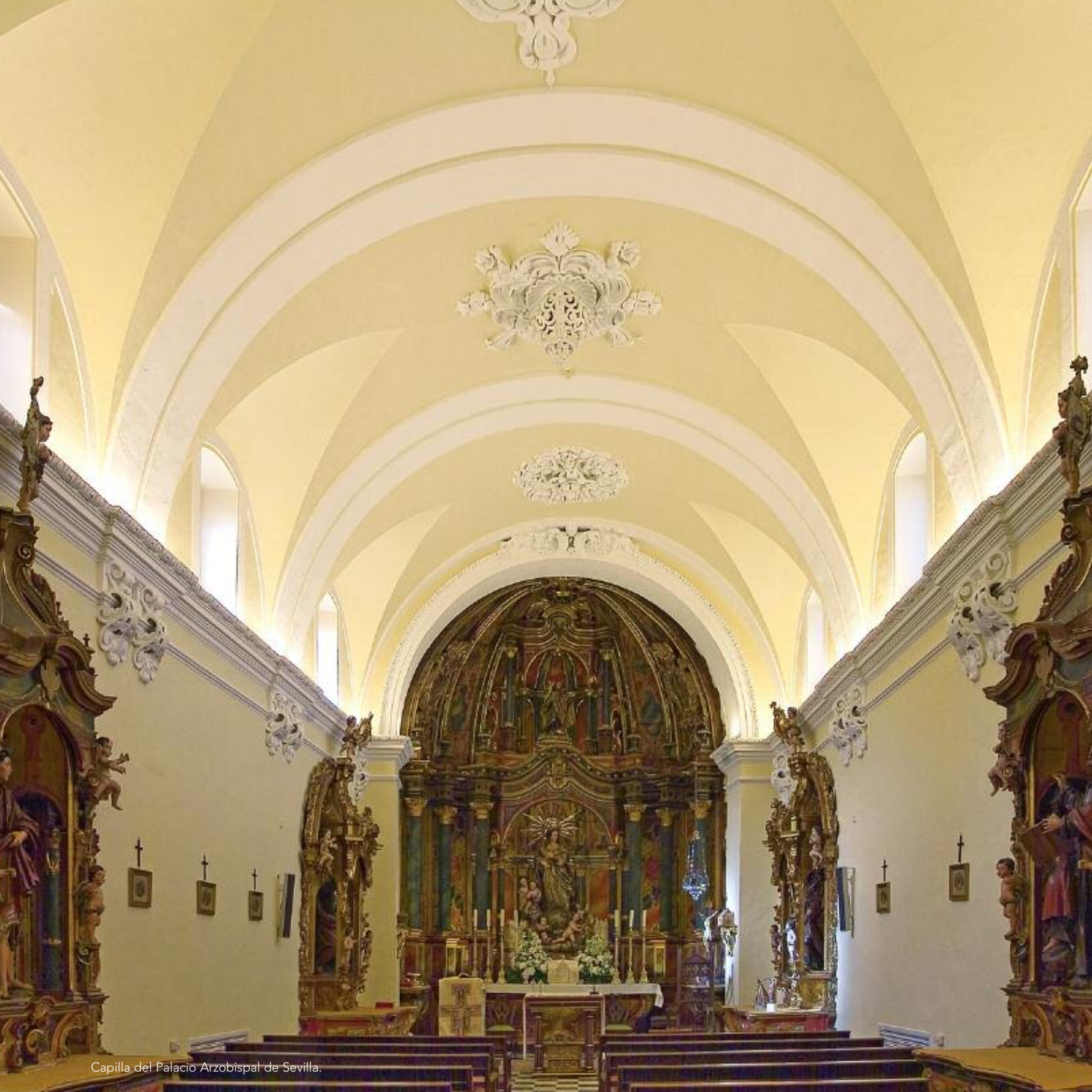
Capilla del Palacio Arzobispal de Sevilla.