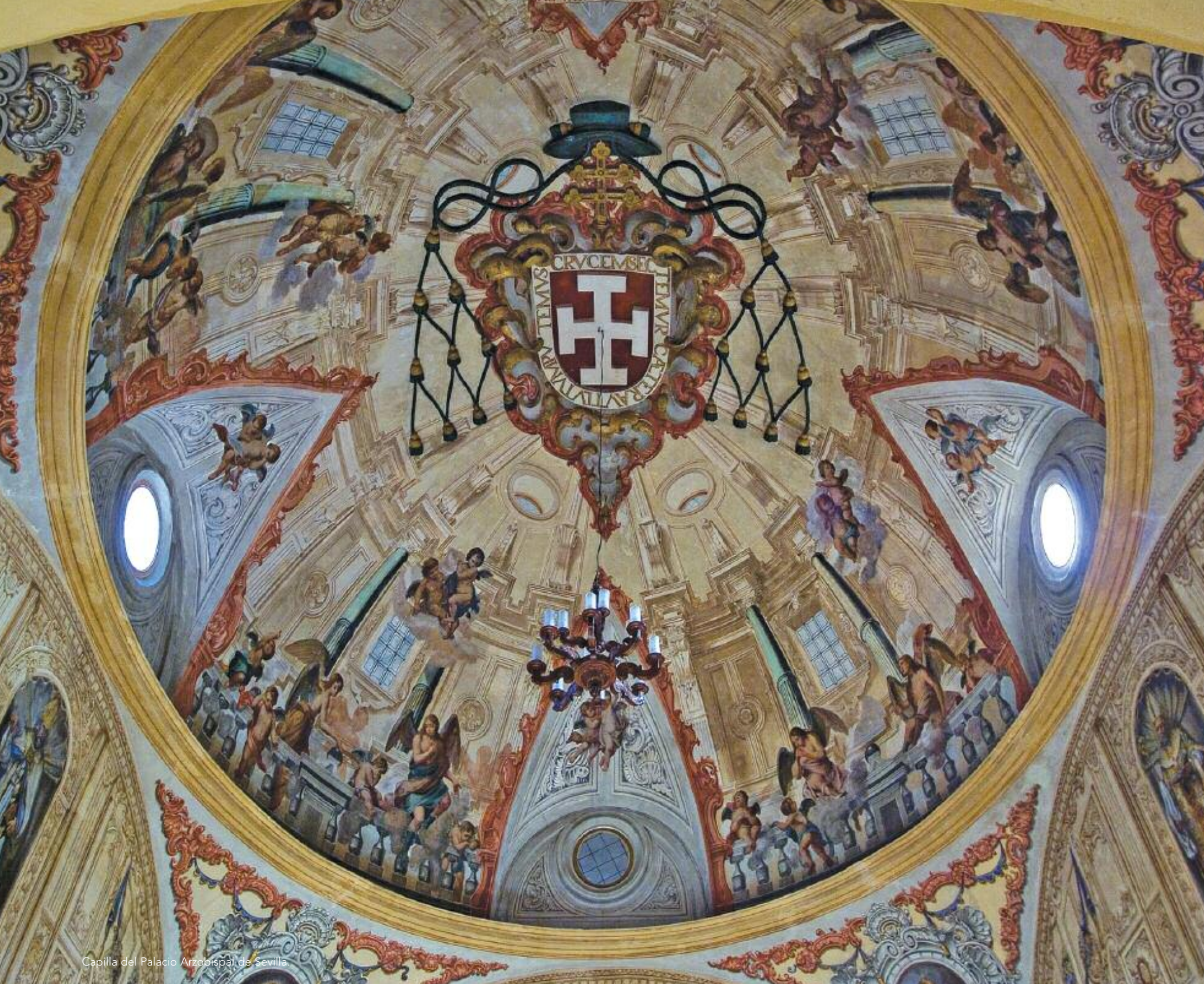
Capilla del Palacio Arzobispal de Sevilla