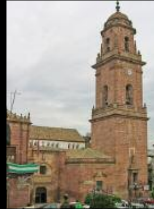
Acuerdo con el Ayuntamiento de Montoro (Córdoba), para la iluminación del Ayuntamiento y de la Iglesia.