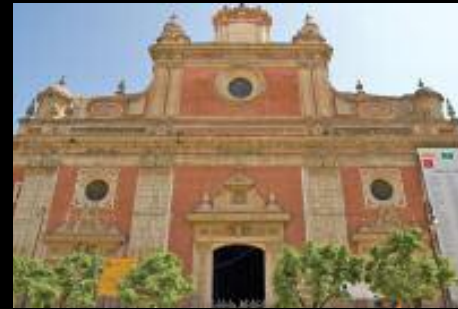
Acuerdo con la Iglesia del Salvador de Sevilla, para la iluminación de la fachada.