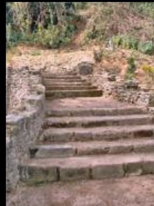
Acuerdo con el Ayuntamiento de Sanlúcar de Barrameda (Cádiz), para la iluminación del Jardín de las Piletas.