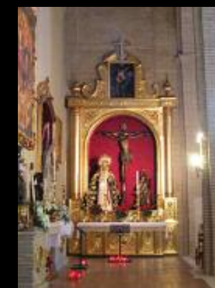
Acuerdo con el Ayuntamiento de Salteras (Sevilla), para la iluminación de la Iglesia de Nuestra Señora de la Oliva.