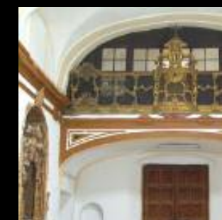
Acuerdo con la Orden Franciscana Seglar de Sevilla, para la iluminación de la capilla.