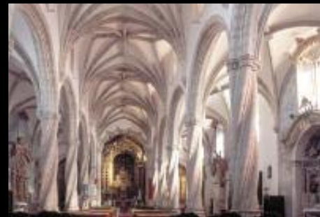
Acuerdo con el Ayuntamiento de Olivenza (Badajoz), para la iluminación de la Iglesia de Santa María Magdalena.