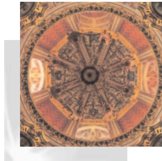
Santuario de Nuestra Señora de Regla, Chipiona (Cádiz)