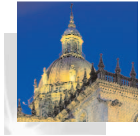
Catedral de Jerez de la Frontera (Cádiz)