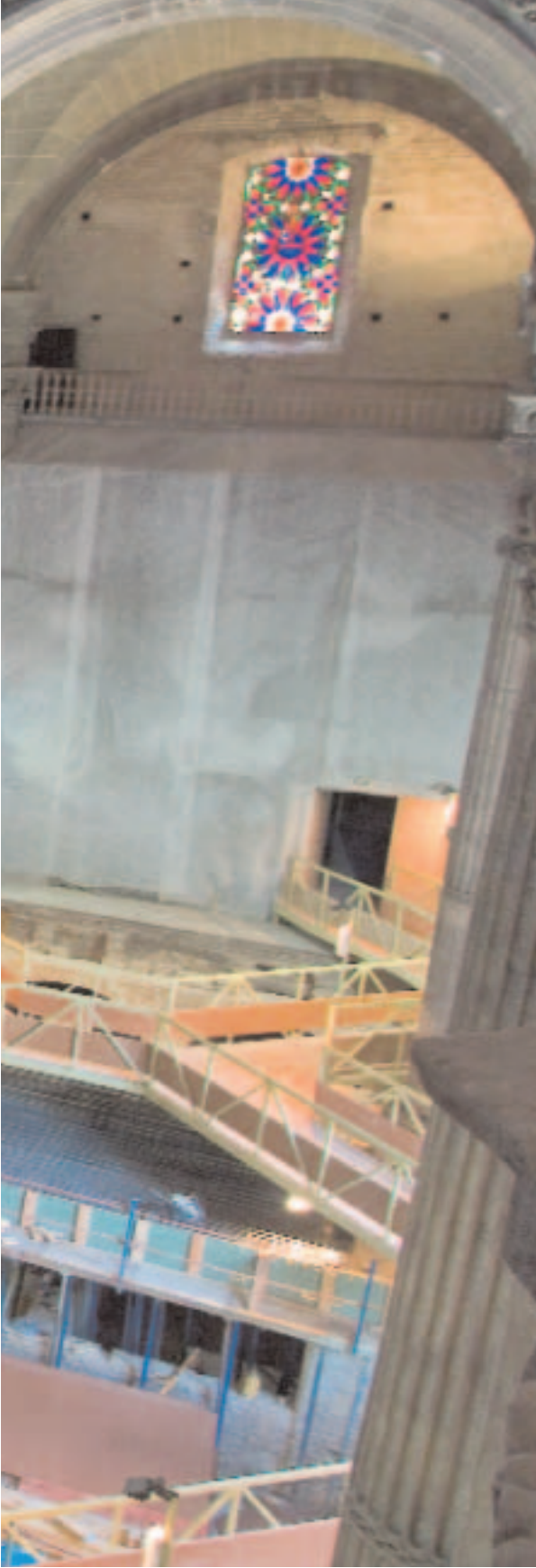
Iglesia Colegial del Divino Salvador, Sevilla