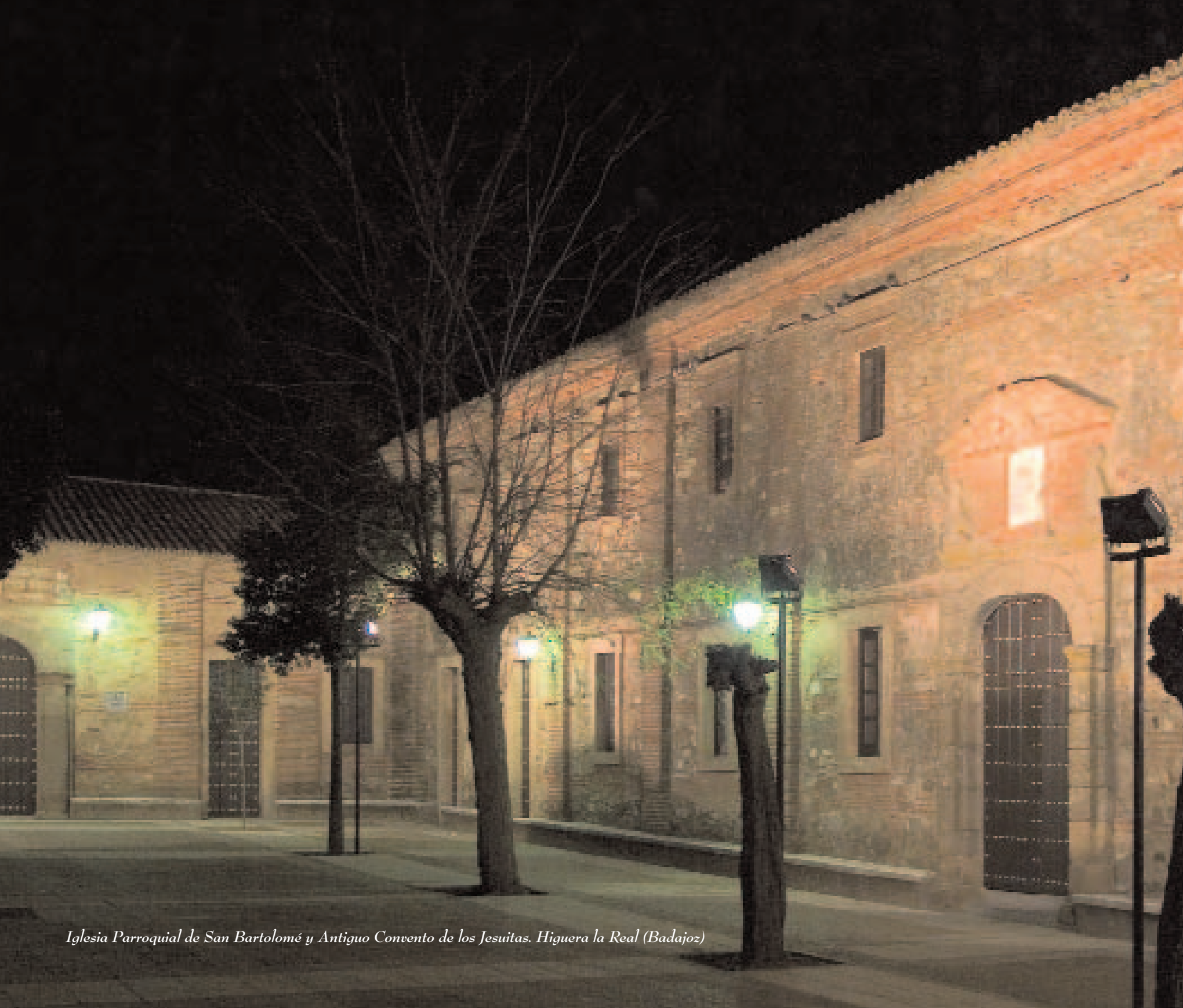
Iglesia Parroquial de San Bartolomé y Antiguo Convento de los Jesuitas. Higuera la Real (Badajoz)