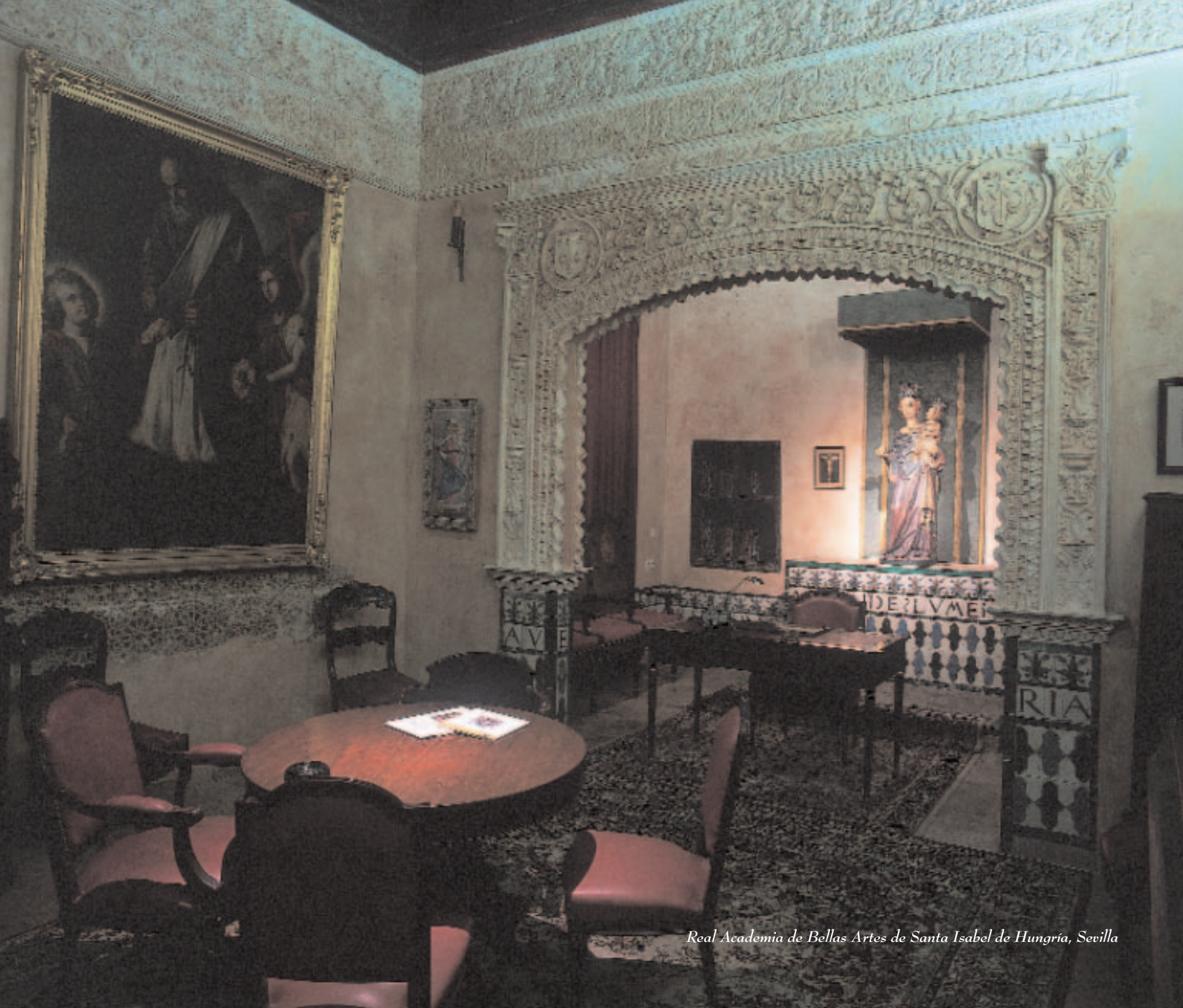
Real Academia de Bellas Artes de Santa Isabel de Hungría, Sevilla