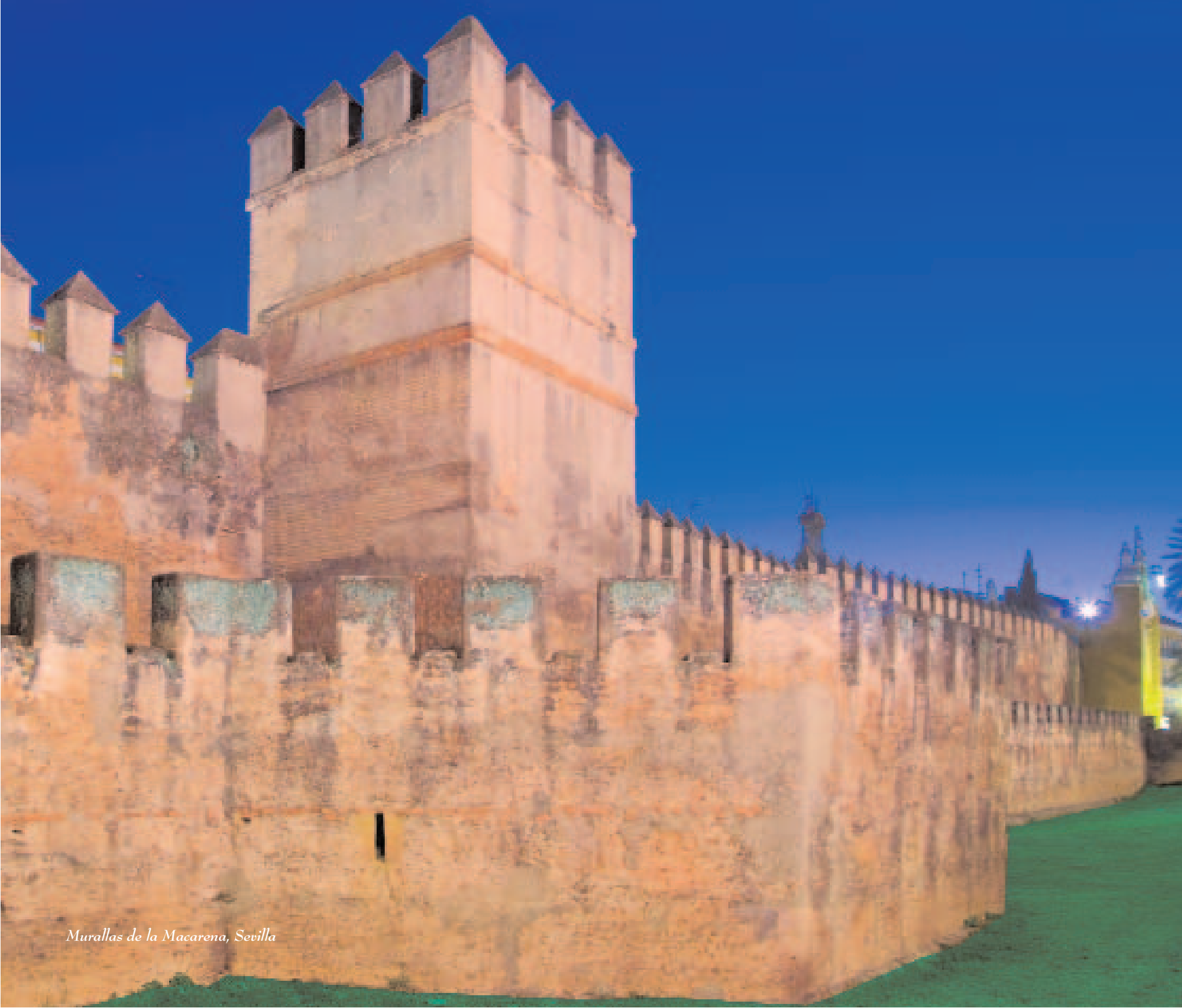
Murallas de la Macarena, Sevilla