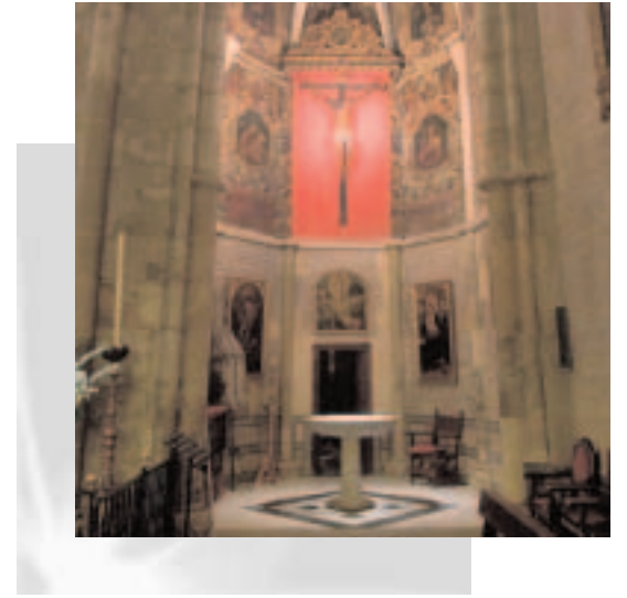
Iglesia Parroquial de Señora Santa Ana de Triana, Sevilla