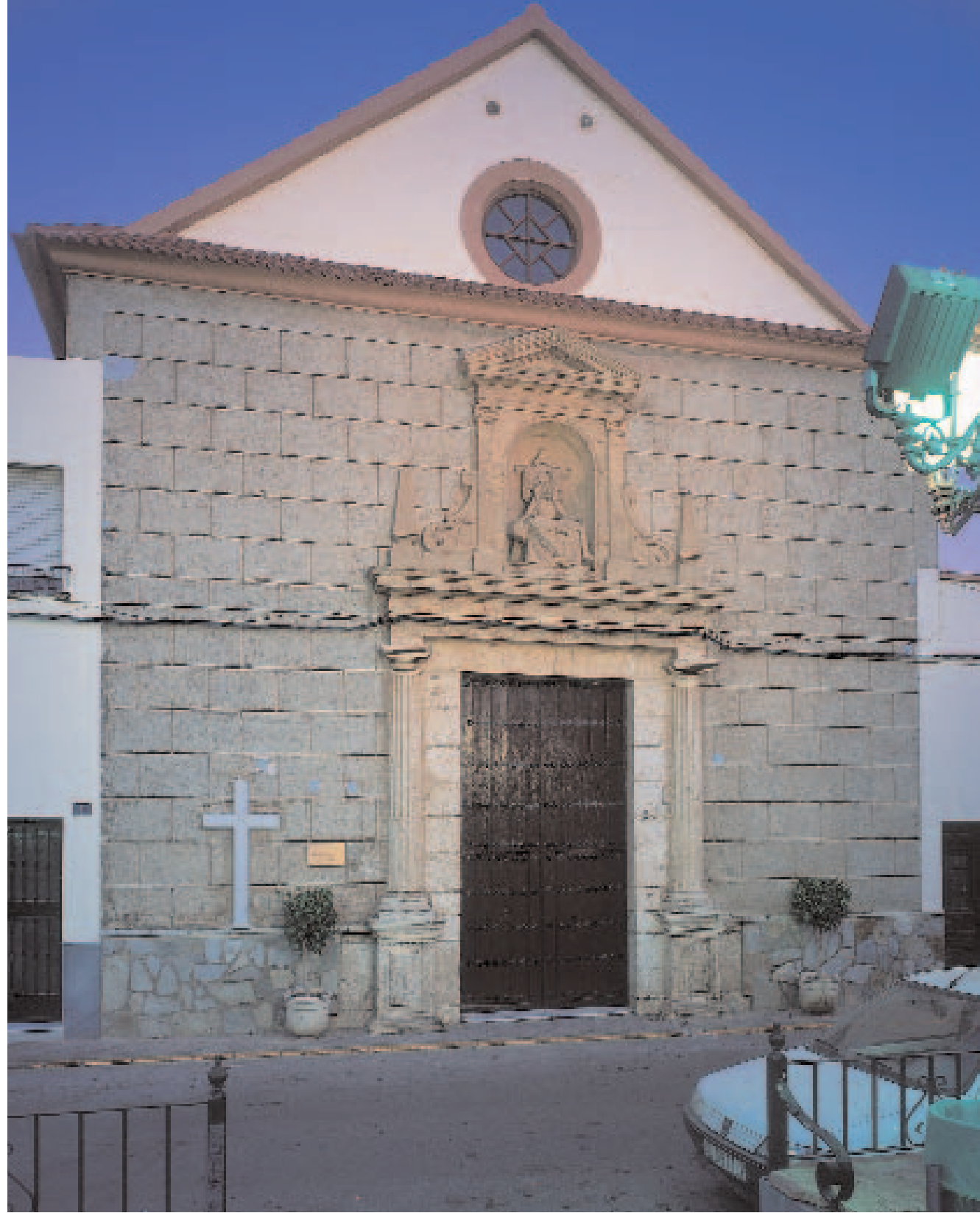
Iglesia Parroquial María Santísima de las Angustias, Viator (Almería)