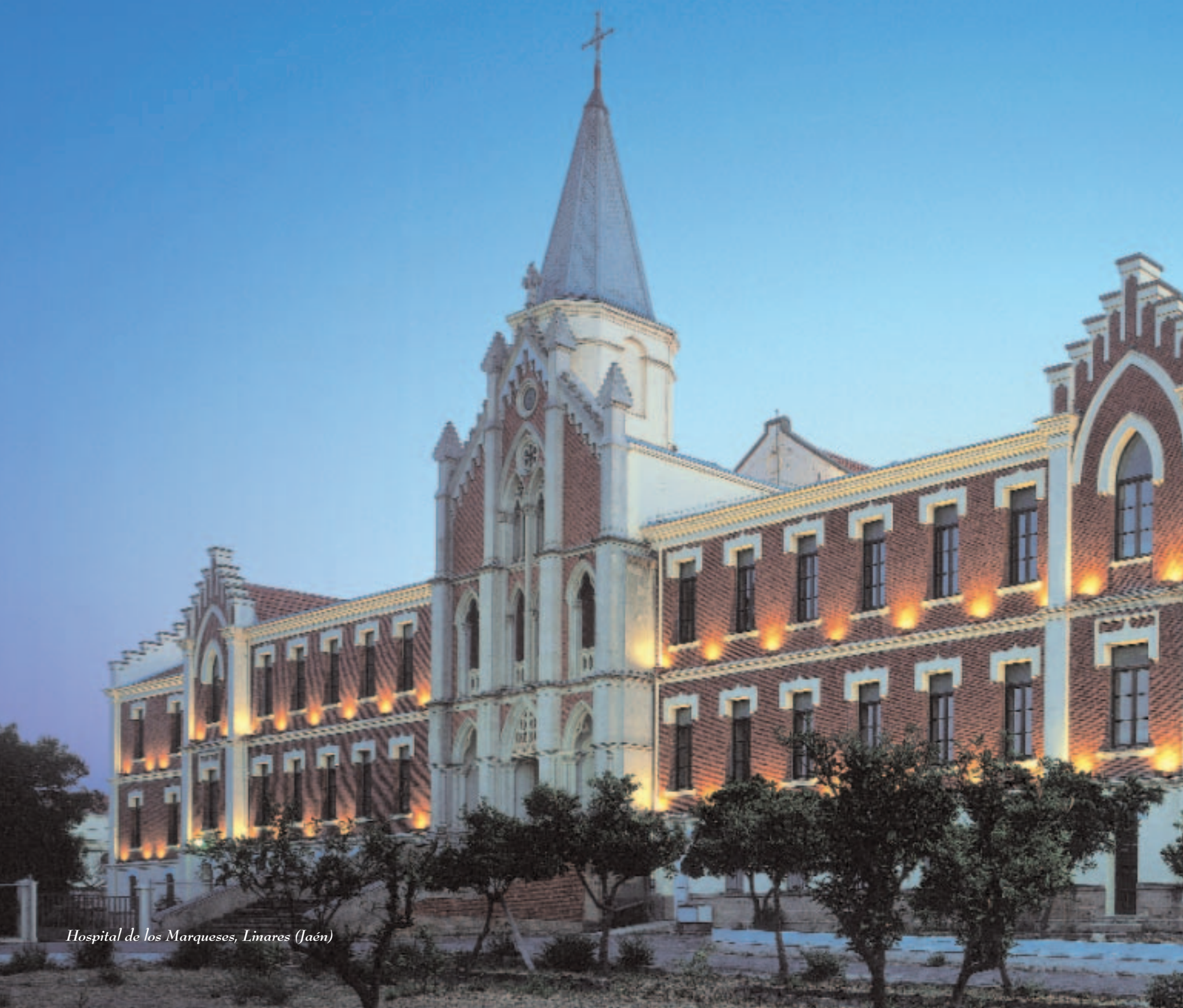
Hospital de los Marqueses, Linares (Jaén)