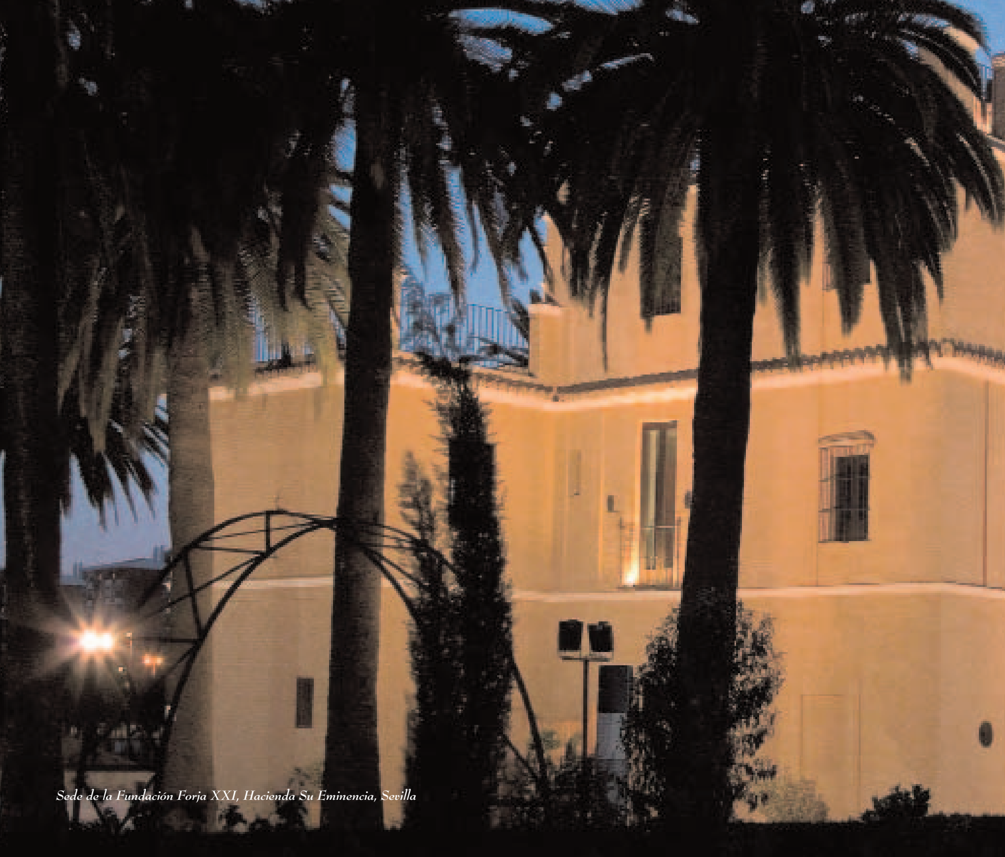
Sede de la Fundación Forja XXI, Hacienda Su Eminencia, Sevilla