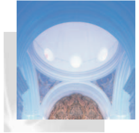
Iglesia Parroquial de Nuestra Señora de Consolación, Umbrete (Sevilla)