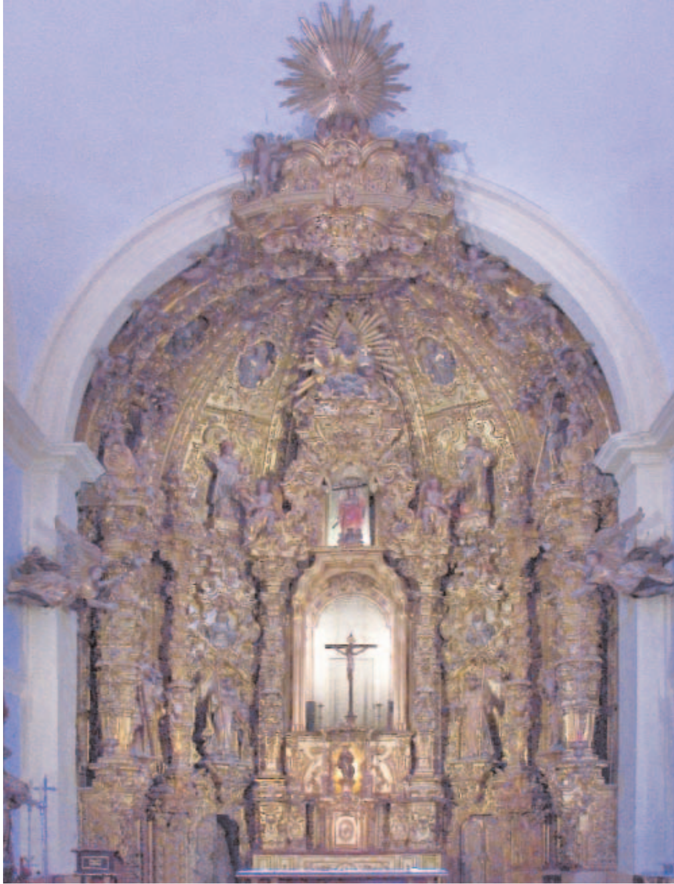
Iglesia Parroquial de San Francisco, El Puerto de Santa María (Cádiz)