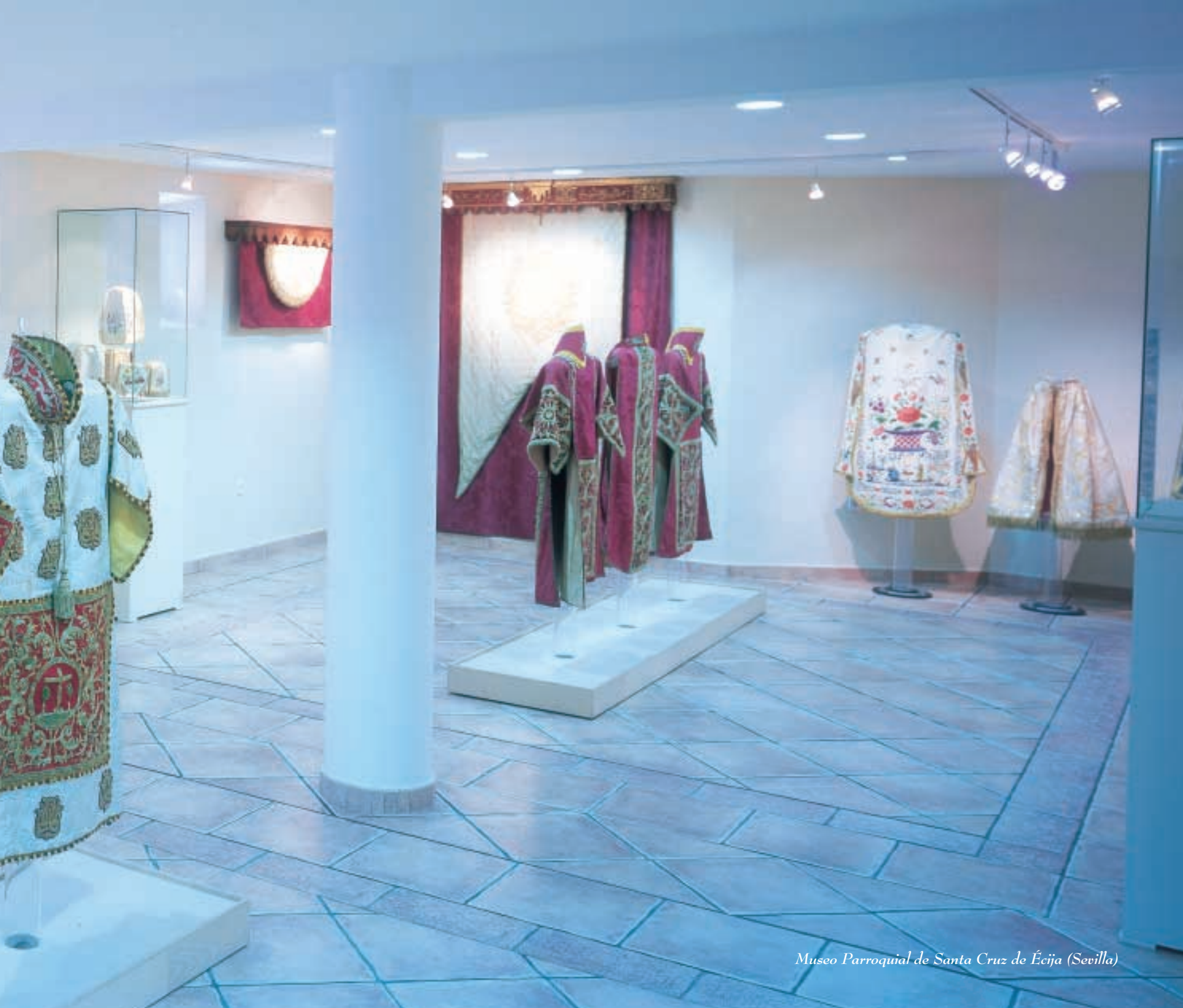
Museo Parroquial de Santa Cruz de Écija (Sevilla)