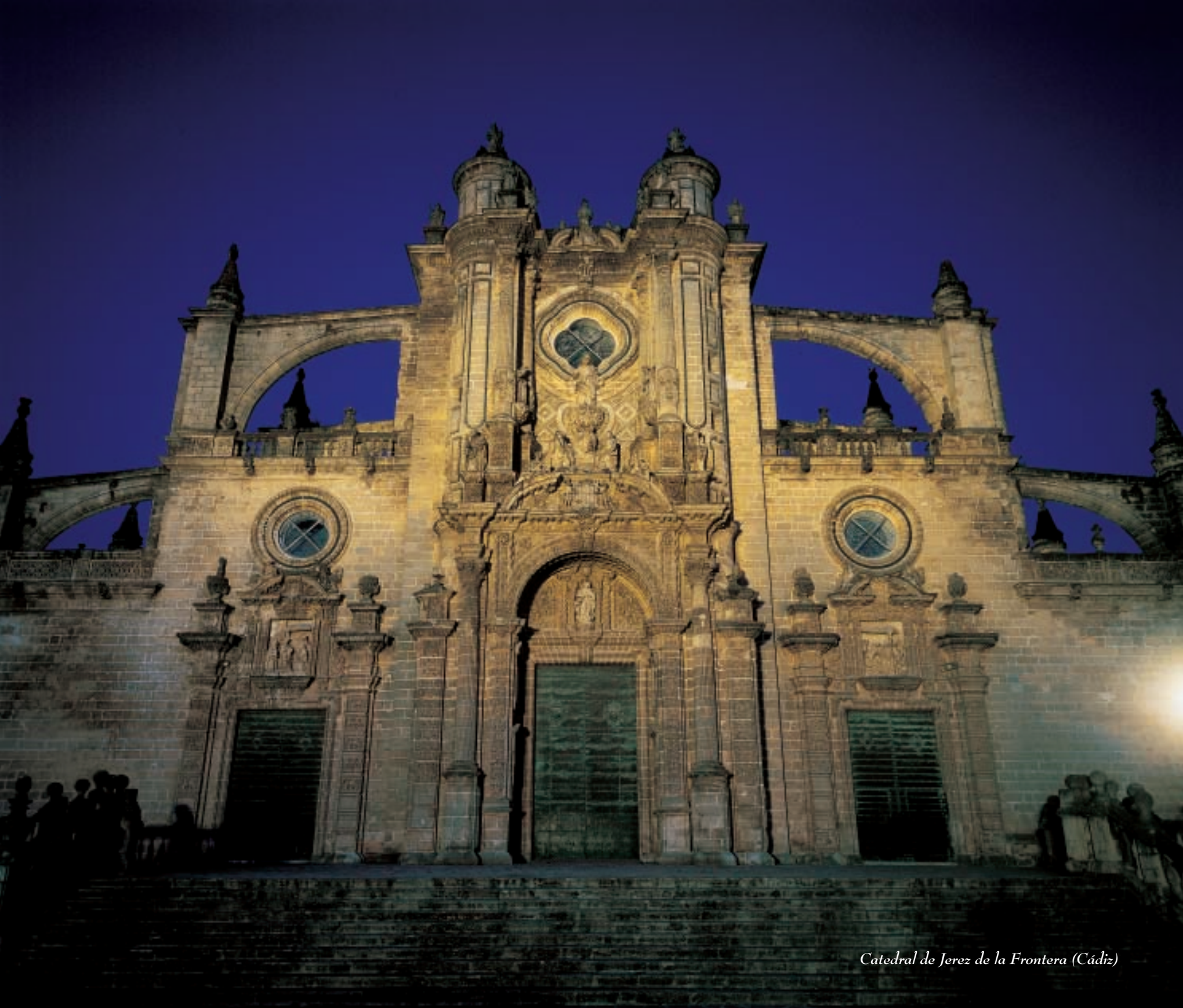
Catedral de Jerez de la Frontera (Cádiz)