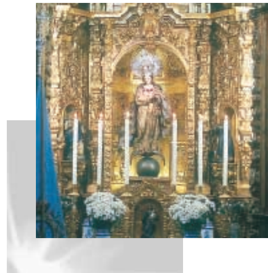
Capilla del Postigo del Aceite de Sevilla