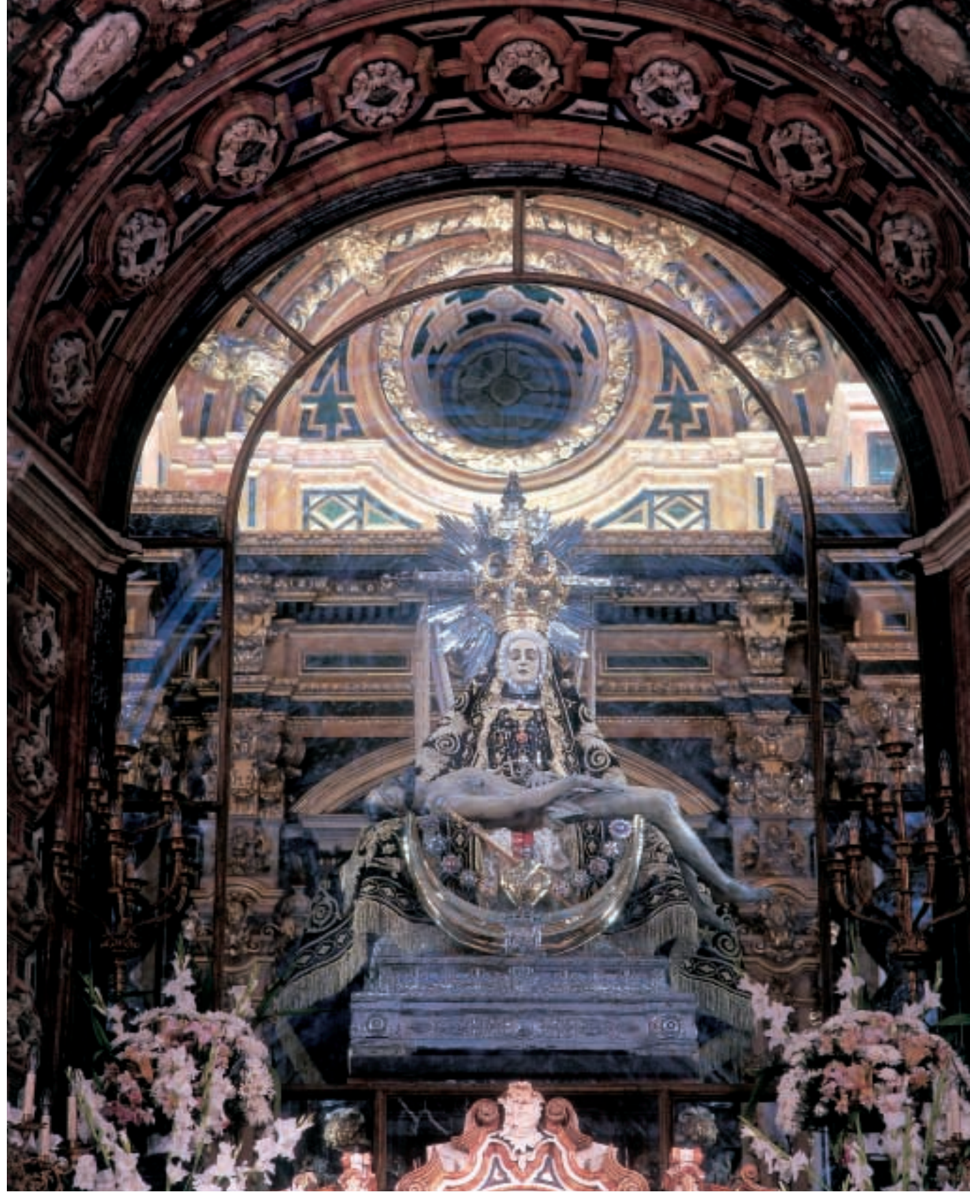
Camarín de la Virgen de las Angustias de Granada