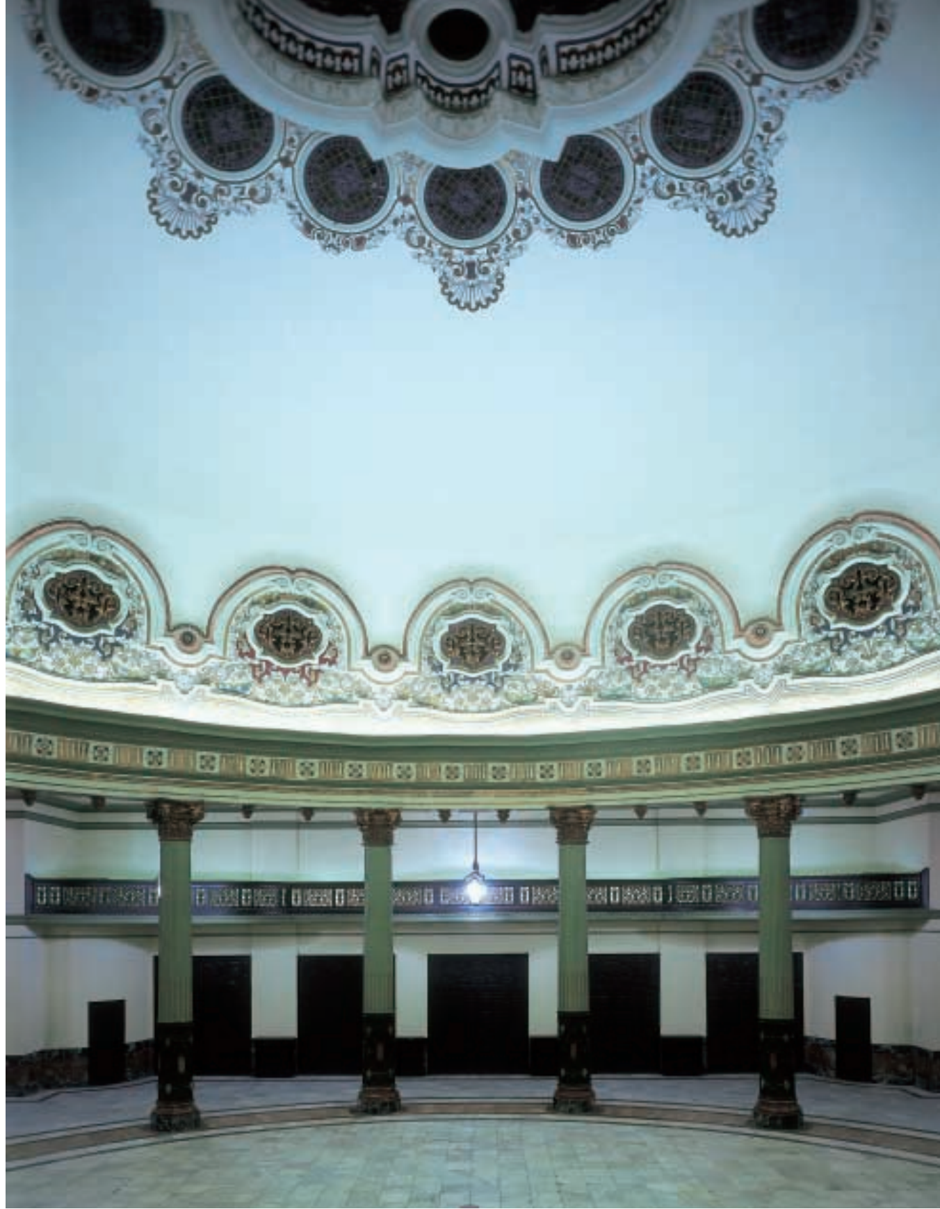
Casino de la Exposición de Sevilla