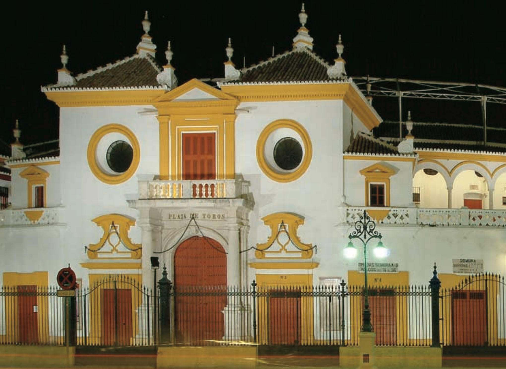
Plaza de Toros de la Real Maestranza de Caballería de Sevilla