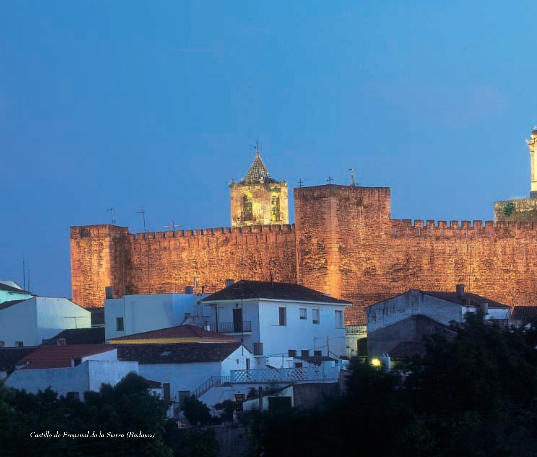
Castillo de Fregenal de la Sierra (Badajoz)