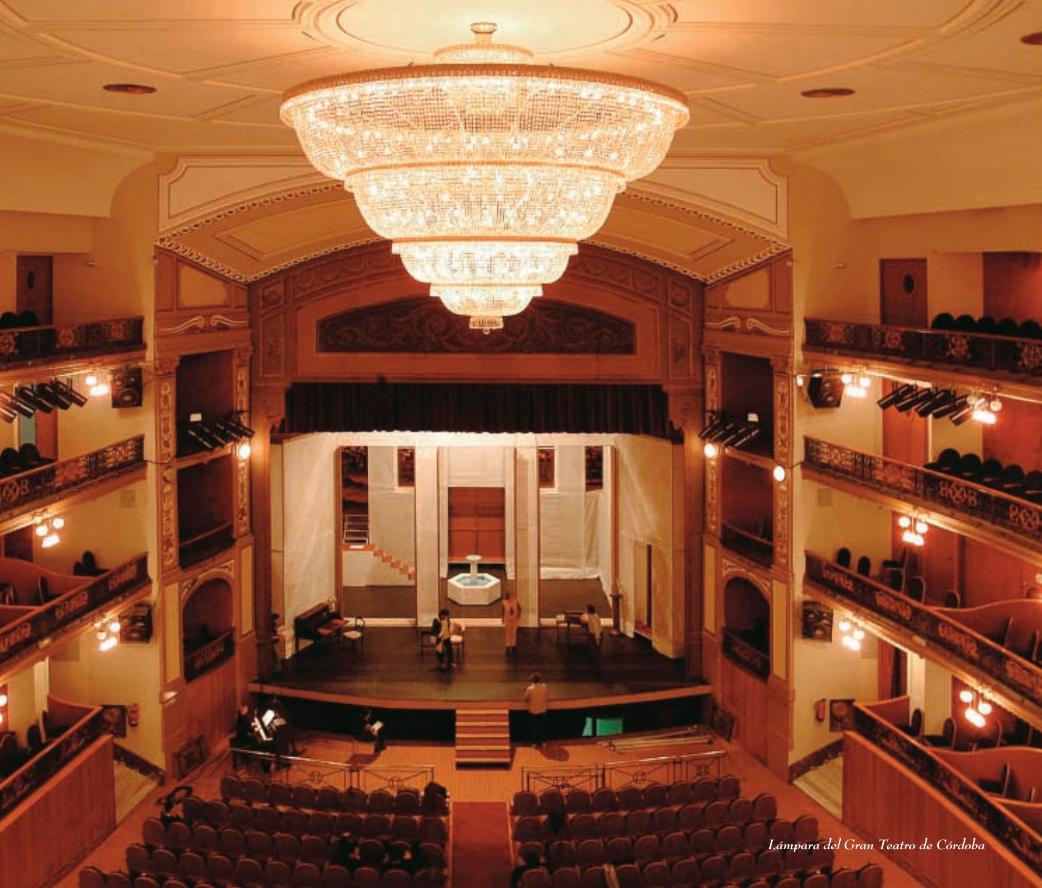
Lámpara del Gran Teatro de Córdoba