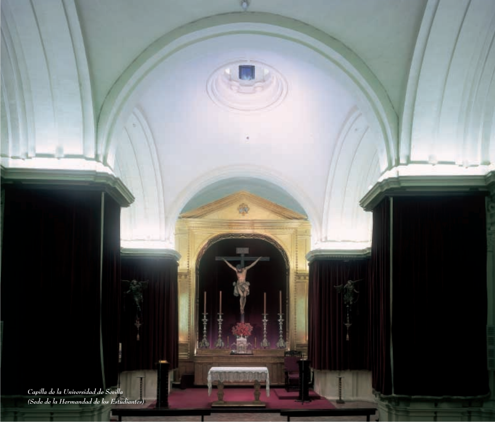
Capilla de la Universidad de Sevilla (Sede de la Hermandad de los Estudiantes)