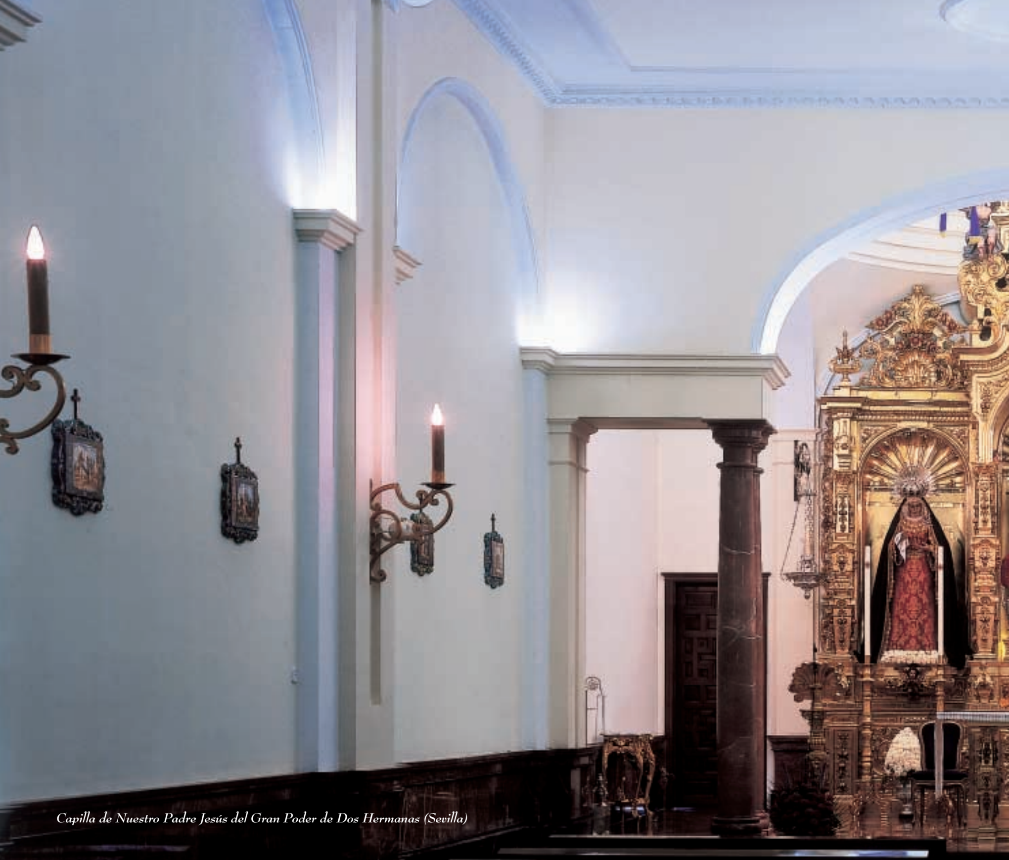
Capilla de Nuestro Padre Jesús del Gran Poder de Dos Hermanas (Sevilla)