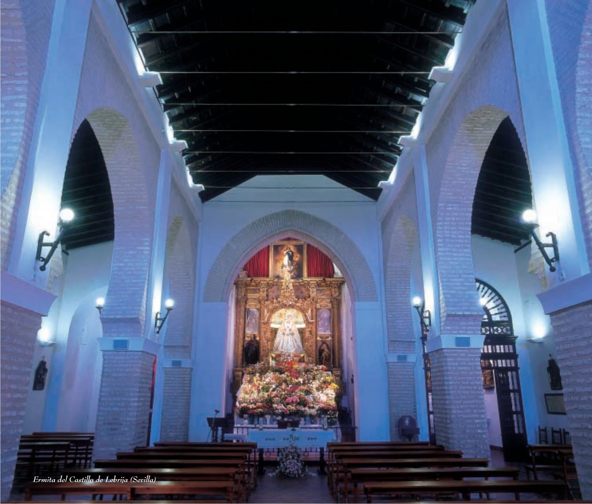
Ermita del Castillo de Lebrija (Sevilla)